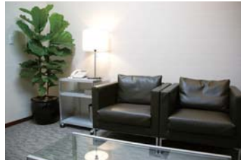
応接室 Reception room