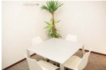
商談室 Business talk room